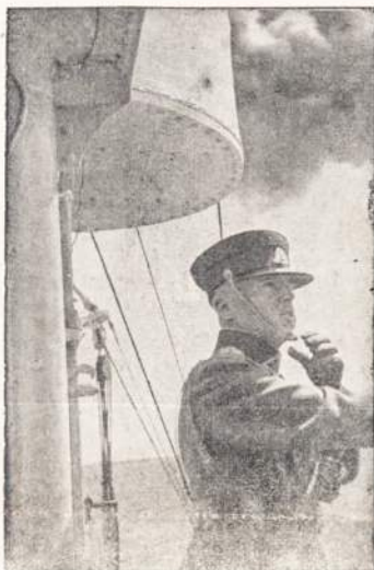
Lietuvos Kariuomenės Vadas BRIG. GENERALAS STASYS RASTIKIS „Prezidentas Smetona“ karo laive.

Pažymėtina, kad vakarų fronte daugiausia veikia tik anglų aviacija. Prancūzų lėktuvai iki šiol labai mažai kur kur pasirodo. Anglų lėktuvai dažnai skraido Vokietijos gijumoje, pasiekdami Berlyną, Vieną, Pragę ir kitus vokiečių miestus. Anglai taip pat skraido tik žvalgybos tikslais.