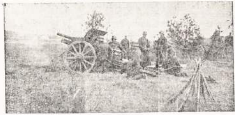
Lietuvos kariai manevruose.

prancūzai apie 100.000 norvegai taip pat apie 100.000. Visuose Norvegijos frontuose eina smarkūs susirėmimai. Šiaurės srityje anglų ir norvegų kariuomenės dalys smarkiai sumušė vokiečius ir užėmė daug svarbių pozicijų. Vokiečiams gerai sekasi tik Švedijos pasieniuose, kur nėra sąjungininkų kariuomenės ir kur norvegų pasipriešinimas labai silpnas.