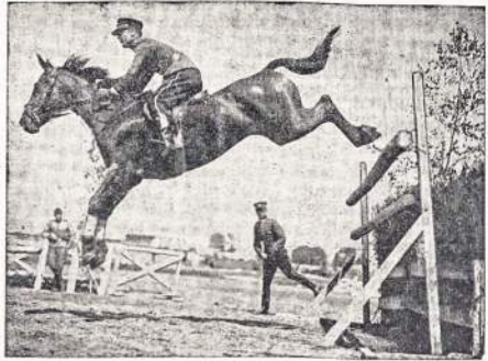
Suolis per kliūtį.