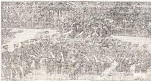
Lietuvių karių orkestras.

Iš Helskino pranešama, kad Suomija projektuoja sukurti naują Baltijos valstybių ekonominę santarvę, į kurią įeity Suomija, Estija, Latvija ir Lietuva. Tuo tikslu jau vyksta pasitarimai. Baltijos valstybių ekonominė santarvė derintų visų Pabaltijai valsty-