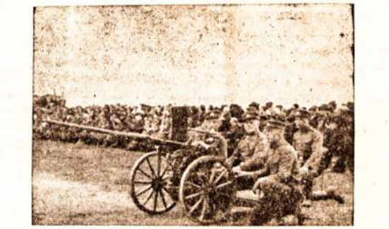
Lietuvos priešlėktuvinė patranka

apie 70 įvairių kursų. Žemės ūkio Rūmai išlaikė 17 žiemos žemės ūkio mokyklų, pernai 7 mokyklose dar įsteigti namų ūkio skyriai mergaitėms. Ūkininkams suorganizuota per 50 ekskursijų ir suruošta kelios dešimtys tvarkingo namų ūkio arodų. Ūkininkams įsteigta 135 žemės ūk. mašinų ir įrankių naudojimo rateliai ir apie 360 javų valymo punktai, be to, pastatyta 273 naujoviškos linų mlynklos. Praeitais metais įrengta apie 1500 ha kultūrinių ganyklų ir sukultūrinta apie 10,000 ha pelkių; keliolikai tūkstančių ūkininkų suteikta įvairių pašalpų sėkloms auginti, mašinom įsigyti žaliesiems įrengti, nuo kelmų ir krūmų ūkiams apvalyti ir pr.