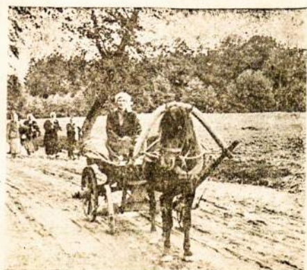
Vaziuoja į turgų...

KAUNAS. — Paskelbti nauji įstatymai, būtent: darbui parūpinti ir darbo įžėjai rikiuoti įstatymas, kai kurių teisinių aumenų turtui Vilniaus miesto ir jo srityje sutvarkyti įstatymas, Kelių Fondo įstatymo pakeitimas, Pasų įstatų pakeitimas, Vilniaus miesto ir jo srities tvarkymo įvedamojo įstatymo pakeitimas. Viešojo atsiskaitymo įs. aigų ir įmonių priežiūros įstatymo pakeitimas, Trūkų ir vangų, Pasų įstatų keitimo. Nekiln. turtui kelių reikalams nusavinti, V. R. M.-jos įstatų pakeitimo ir apieštų ūkių priežiūros įstatymo projekto.