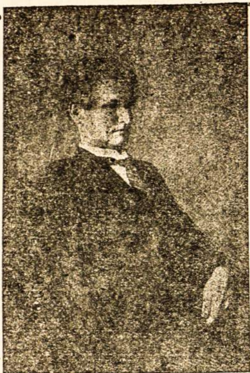
Lietuvos Valstybės dabartinis Prezidentas P. Antanas Smetona ir buvęs Prezidentas P. Kazys Grinius.

Pastaba: P. Smetonos valdžia paskyrė P. K. Griniui pensiją iki gyvos galvos po 1200 lit. mėnesiui.