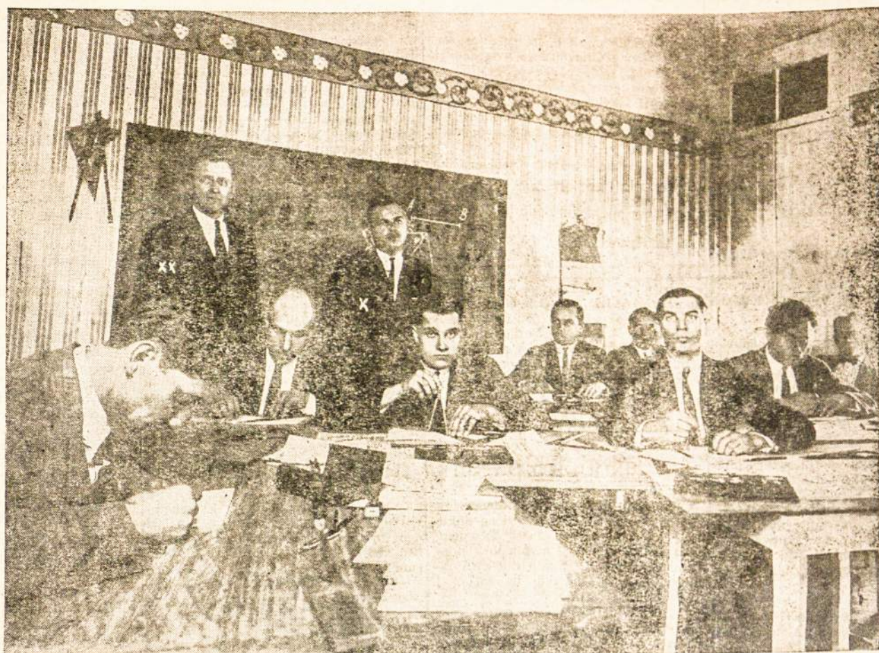
Lietuvių klubo kursai. Braižytojų grupė. x) Kursų profesorius. xx) Kursų vedėjas.