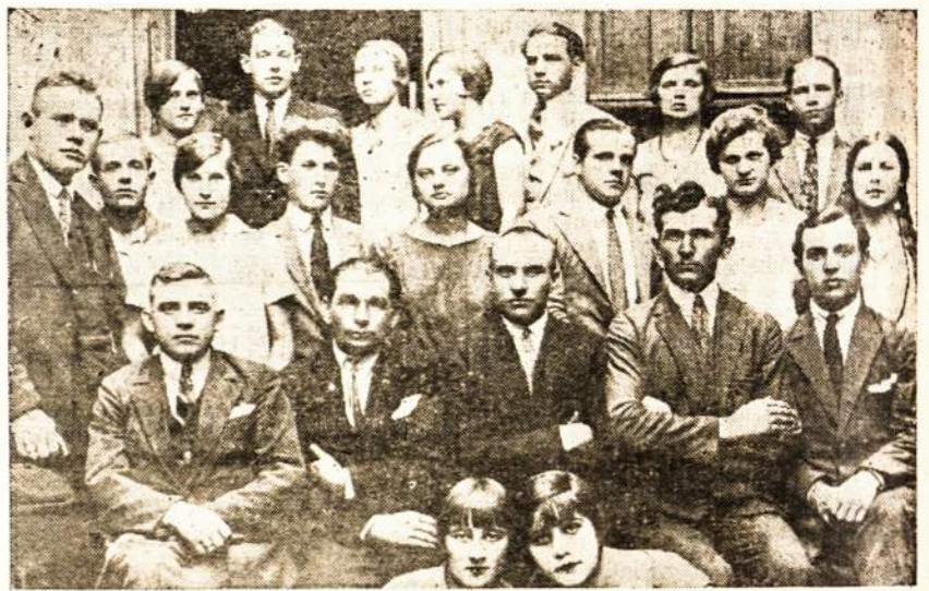
Pirmojo spektaklio (1927 m. Lapkričio 19 d.) dalyviai.

lietuviškų laikraščių yra didelis skirtumas (Neturiu galvoje ideologinio skirtumo). Vienas jų yra laisvas nuo viso ko ir tarnauja kaip įrankis paplėsti išeiviams lietuviams akylratį, o antras — apsilarvavęs šmeižtu ir, lyg iš bepročių namo išėjęs, klieda nei šį nei tą.