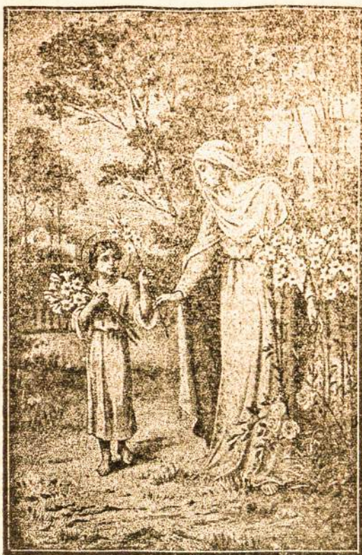
Švenč. Motina Marija su savo dieviškuoju Vaikeliu.

Atsiminkime Lietuvos Gegužio mėnesio vakarus. Dvelkia švelnus vėjelis. Kvepia alyvos ir tik ką išspręgtų beržai. Seklyčioje prieš Marijos