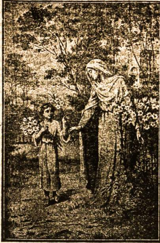
Švenč. Motina Marija su savo dieviškuoju Vaikeliu.

Atsminkimė Lietuvos Gegužio mėnesio vakarus. Dvelkia švelnus vė- lėlis. Kvėpia alyvos ir tik ką išpro- gę beržai. Seklyčioje prieš Marijos