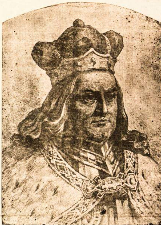
D. L. K. VYTAUTAS DIDYSIS.

Šiomet visa Lietuvių Tauta švenčia jo 500 metų mirties sukaktuvės Lietuvių kolonija Brazilijoje irgi tas sukaktuvės iškilmingai minės spalį 27 d.