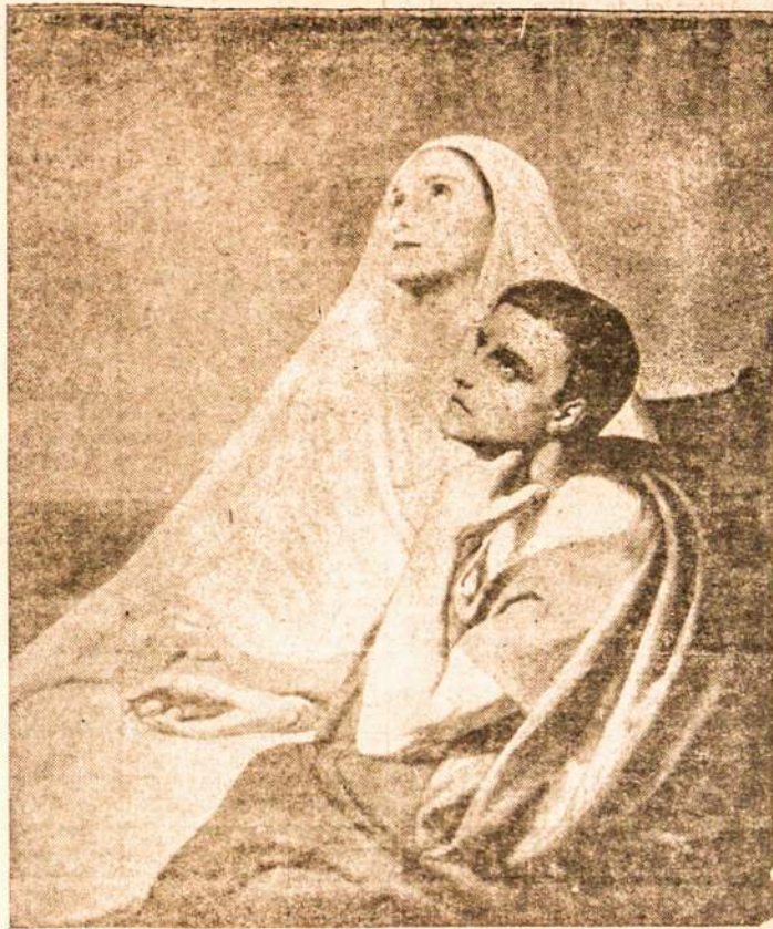
Šv. Augustinas su savo motina šv. Monika.

Vytauto tėvas buvo kunigaikštis Kostutis, o motina — Birutė, Žemaičių kunigaikštė dukterė. Kilimu abudu, kaip matome, buvo tikri Lietuvos vaikai.