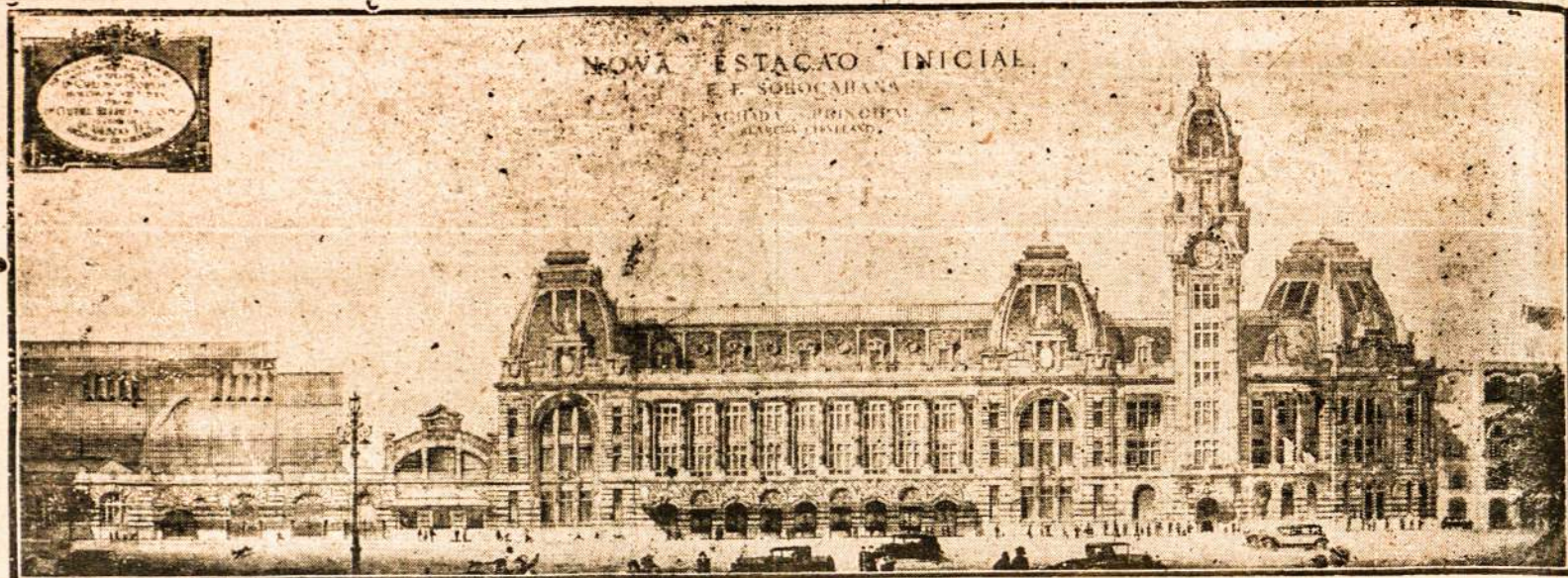
NAUJA SOROCABANA STOTIS S. PAULO MIESTE. Yra tai gražiausia stotis beveik visoj Brazilijoje.