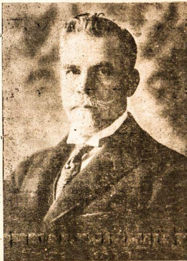
D-ras Washington Luiz, dabartinis Brazilijos Respublikos prezidentas, kurio prezidentavimo laikas baigiasi šių metų lapkričio m. 15 d.

„Šviesos“ B-vės Valdyba ir „Lietuvio Brazilijoj“ Redakcija.