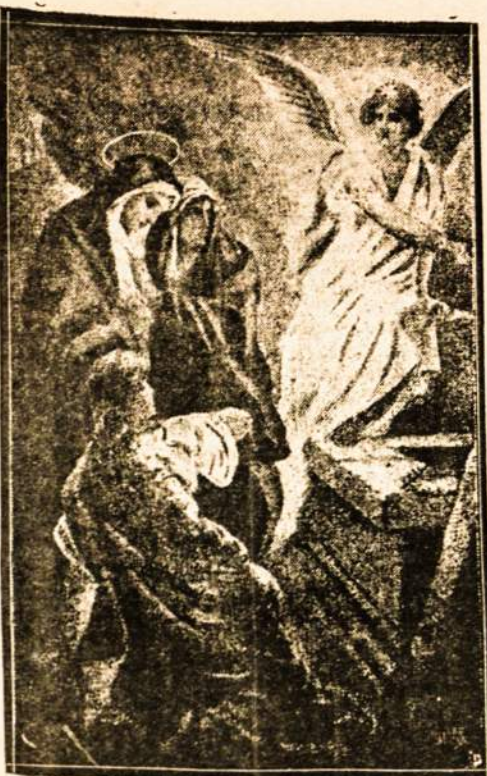
Jūs ieškote Jėzaus... Jo ėja nėra, nes Jis prisikėlė, kaip yra sakęs...