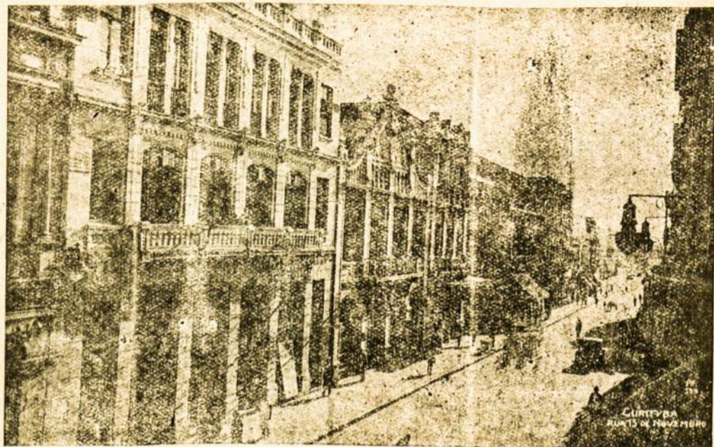
Viena iš PARANOS estados sostinės miesto CURITYBA gatvių: rua 1 de Novembro.