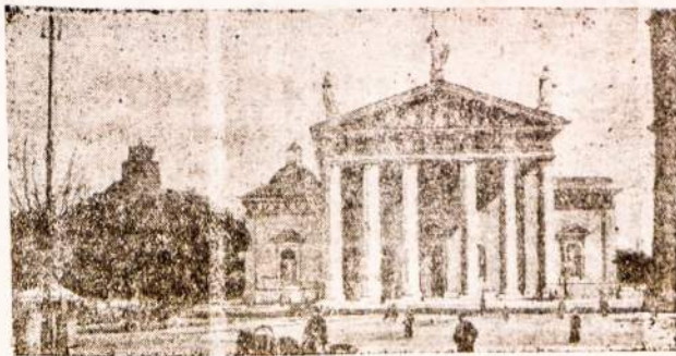
Lenkų užgrobtame Vintuje. Katedra.