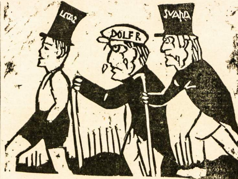
Tai atėjo laikai, kad vaikai senius pradės už nosies vedžioti. Kaip va: vos 10 metų kaip litas atsirado, o dabar tvirčiausiai stovi.

Kaip tikrai atvėso oras, Pakalbėti ima noras. Kaip ateina švelnios dienos, Tuoj grafesnės ir naujienos. Kai klausai naujieną gerą, Žmogui linkama pasidaro, Kai išgirsti žinią blogą, Gauni gripą arba slogą. Bet vistiek reikia brolyti, Viską nuo pradžios klausyti. Blogą peikti, gerą girti, Grūdus nuo pelų atskirti. Jei išgirsit gražų faktą, Dėkite giliai į kaktą. Kai išgirsit kekį brudą, Meskite šunims į būdą. Taigi prašome už stalo, Ir pradėsime nuo galo. Lietuvoje, ačiū Dievui, Upės neapsėmė pievų, Ir baisios potvinių marės Nuostolių mums nepadarė. Bet kitų valstybių vietos Buvo potvinių užlietos. Dauguva apsmėtę kygą Ir įvarė latviams ligą.