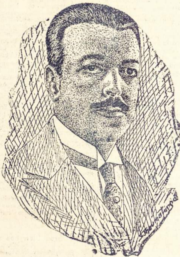
Dr. Julio Prestes, Brazilijos respublikos prezidentas.

Santa Clara, Ispanijoje rasta 200 žmonių griaučių, nužudytų 16 šimtmečio inkvizicijos laikais.