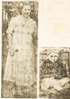
Sūnus ir duktė išpiršo motinai jauniki

Petrylienė, kuri pabėgo su kitu vyru palikdama mažą kūdikį