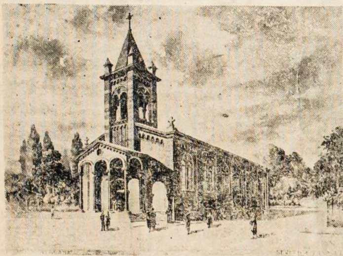
STATOMOS BAŽNYČIOS VAIZDAS.

Priėmimo valandos: nuo 8 iki 12 ir nuo 2 iki 5 Sventadieniais nuo 9 iki 11 val. dienos.