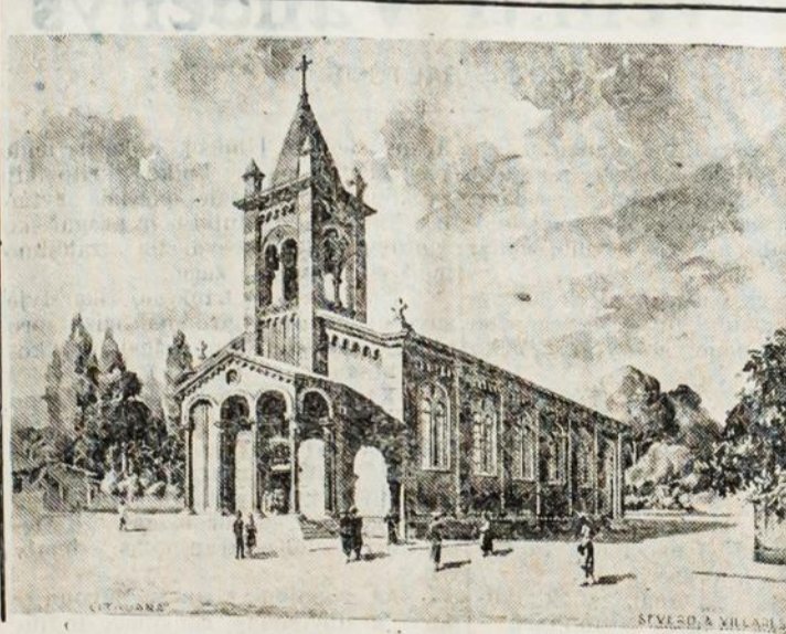
STATOMOS BAŽNYČIOS VAIZDAS.

Adresas: rua Duque de Caxias, 63. SÃO PAULO