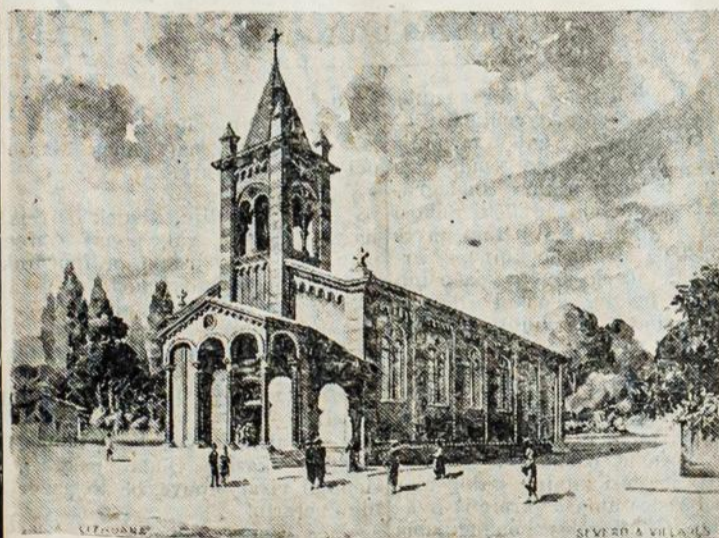
STATOMOS BAŽNYČIOS VAIZDAS.

Adresas: rua Duque de Caxias, 63 SÃO PAULO