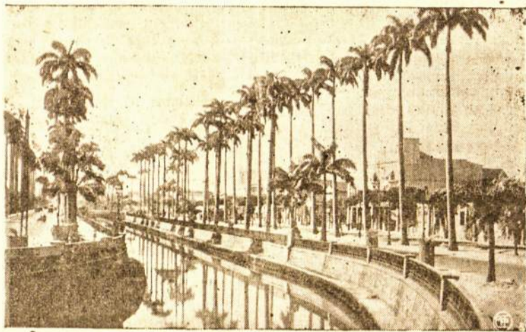
Mangue kanalas skaitomas gražiausiu Rio de Janeiro mieste

mą apie lietuvių visuomenės esamą padėtį. Be to, memorandumas dar įteiktas švietimo įvadovybei ir kitiems aukštesiems lenkų valstybės asmenims.