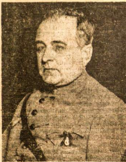
Brazilijos Resp. Prez. GETULIO VARGAS

Sausio 6 dieną orlaiviu "Tupan" Brazilijos Respublikos Prezidentas Getulio Vargas, lydimas aukštų Brazilijos vyrų, išvyko į Porto Alegre, kur dalyvaus Urugvajanoje įvykstančiose iškilmėse. Šiose iškilmėse bus šventinamas fundamentinis per Urugvay upę tilto akmuo, kuris jungsias Braziliją su Argentina. Vietos laikraščiai praneša, kad sausio 6 d. 4 val. vak. Getulio Vargas buvo sutiktas Porto Alegre aerodrome. Susirinkusi didžiulė žmonių minia su entuziazmu sveikino Respublikos Prezidentą, nes tik per Jį šalis tapo sutvarkyta ir tik per Jį Brazilija pasiekė aukščiausio pasaulio progreso.