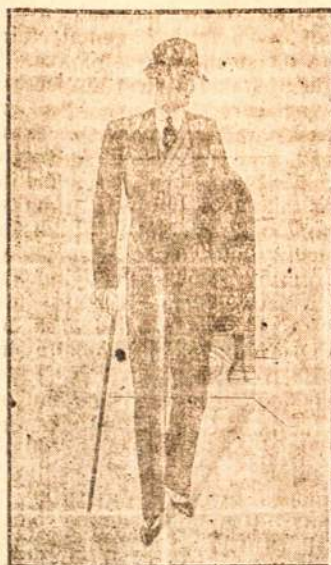
Duque de Caxias, 257 Telephone 4-1457

siūvami pagal naujausias madas rūbai iš įvairiausios medžiagos — vietinės ir užsieninės. Darbas pagal savo kokybę yra pigus, atfiekamas sąžiningai, diplomuoto siūvėjo Galecko prižiūrimas.