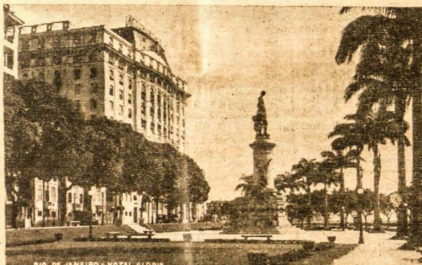
Hotel Gloria (RIO)