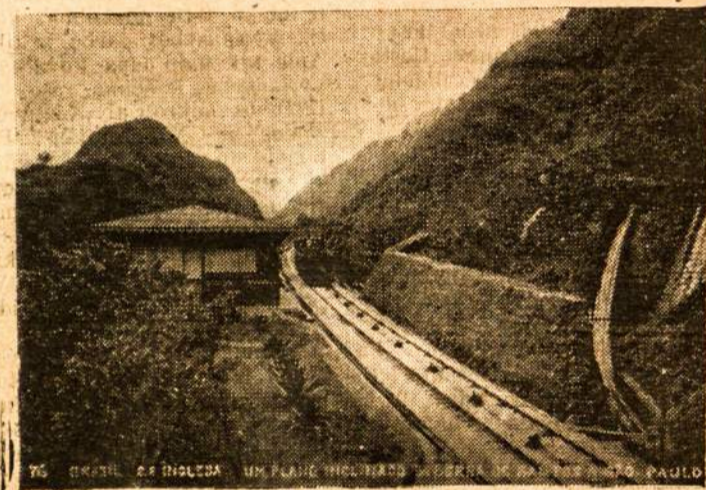
Galežinkelis tarp S. Paulo ir Santos

ais metalais, išaugo miestas Magadans ir uostas Nogajevo.