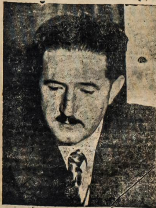
São Paulo Estado galva Dr. Adhemar de Barros