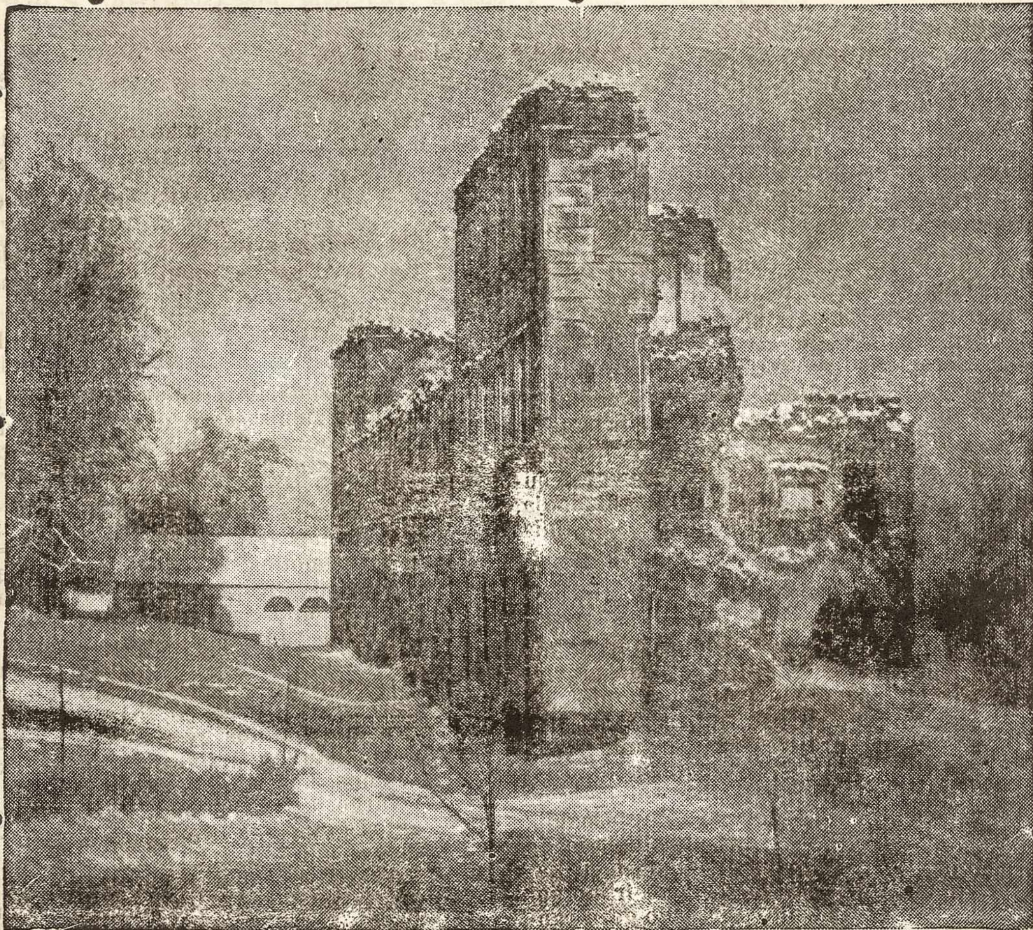
Žilosios Lietuvos praeities paminklai — griuvėsiai

Lietuvė motina pergyveno ir pakėlė, kaip motina, visas mūsų tautos gyvenimo sunkenybes. Kaip motina ji visais laikais buvo pirmose eilėse su visais tais, kurie kovojo ir tebekovoja už mūsų tautos laisvę. Pagerbkime ją už tai, kaip kad gerbiame savo karžygius. O mūsų motinos, kurios šiandien atsidūrė svetur, įvairiuose pasaulio kraštuose, ir ypač jaunosios motinos, kad visada prisimintų, kokia yra buvusi mūsų motinėle mūsų brangiojoje tėvynėje, kokia yra lietuvė motina, ir kad nors dalį duotų to savo vaikams, ką jos pačios yra gavusios, kai anais laikais kiekvieną vakarą senoji motulė klupdydavo kalbėti poterių ir mokė pirmųjų lietuviškų žodžių.