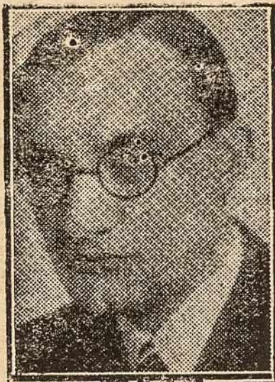
STASYS LOZORAITIS Lietuvos Diplomatinijos Šefas

tinjams, išblaškytiems svetimuose kraštuose. Tokiomis aplinkybėmis neretai gali atsirasti pavojaus nutautėti. Jam