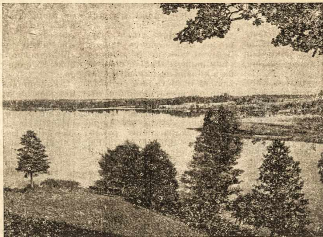
Gražus Lietuvos vaizdeis

Komunistų špionazui sudaro palankias sąlygas ta aplinkybė, jog Maskva reikalauja iš kiekvieno komunisto, kurio krašto ar tautybės jis be būtų, visiškai ir aklo Rusijos komunizmui paklusnumo. Šeimos valstybės komunistai turi tiek lenkus Maskvai, kad turi daryti savo krašto išdaviką, kad pasidaryti ištikimu Stalino tarnu.