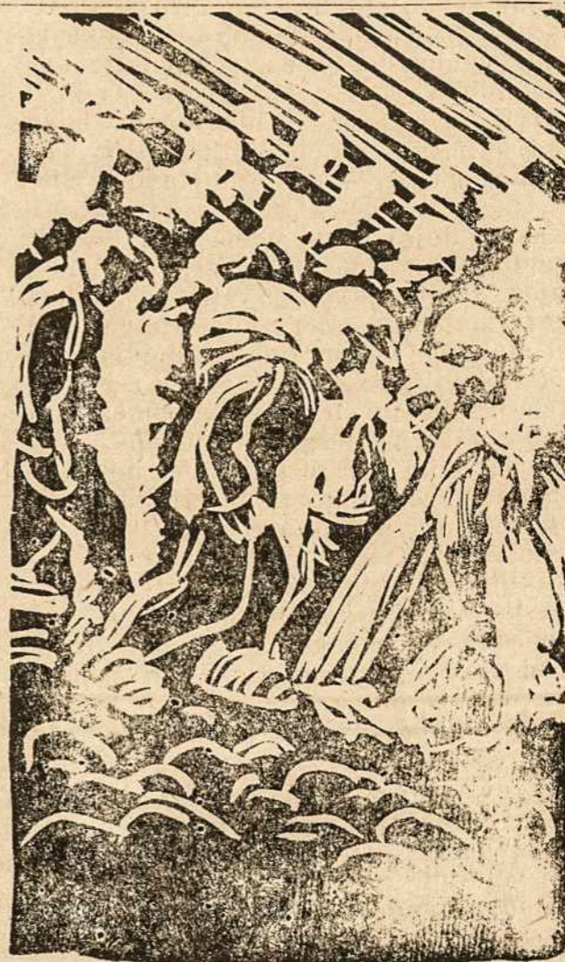
Trėmimai vergų darbams į Sibirą.

Nežiūrint didelio spaudimo, gyventojų nepasitenkinimas komunistais yra didelis. Leipcige ir kitur vyksta protesto demonstracijos.