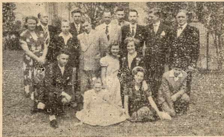
Organizuotoji S. Paulo lietuvių moksleivija su savo rėmėjais. Lietuviškos moksleivijos sambūris į savo eiles kviečia visą lietuvišką mokslus einantį jaunimą.