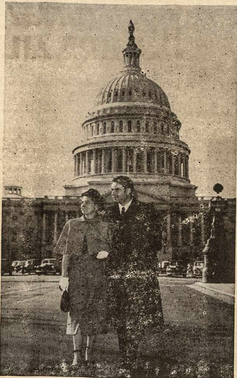
Gyvieji liūdininkai čekoslovakai iš anapus geležinės uždangos Vašingtone prie Baltųjų Rū- mų. Jei dar kas abejoja apie koncentracijos sto- vyklas Rusijoje, tepasiklausia šių daugelin tūk- stančių kitų patekusių į laisvą vakarų pasaulį.

Ir tu ateivio at'tolinta būsi, Vargšė lietuvė, nuo gimtinės tavo Ir užmiršimė vilnyje pražūsi, Tiktai liūdnesnė, tik be brolių savo.