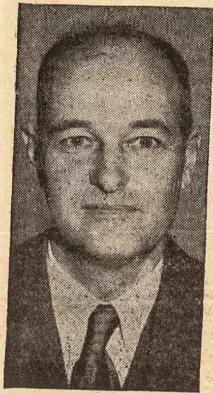
George F. Kennan

Gi De Gaulle turejės 35 atstovus, tesurinko 25. De Gaulle visą laiką buvimas opozicijoje nepatinkina visuomenės. Balsuotojai pasisako už dirbančius krašto gerovei.