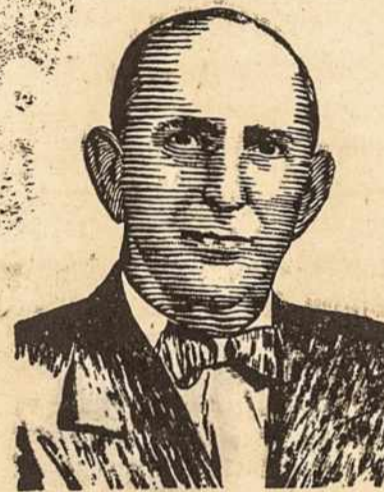
Richard B. Russel, senatorius Georgijos valstijos, galimas demokratų partijos kandidatas į prezidentus.

bus suruošta tarptautinė paroda. Bus ruošiami įvairūs tautiniai kongresai, suvažiavimai, mokslo, literatūros, meno ir kt. Numatoma taip ir masinė sporto šventė. Tai pat numatoma tarptautinė futbolo, krepšinio ir kitų sporto sričių olimpiados.