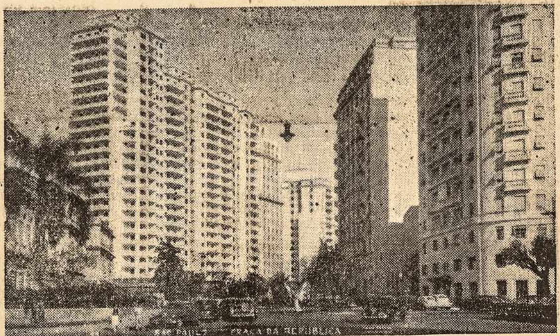
Dinamiškai greitai augančio didmiesčio, S. Paulo (2,5 mil. gyv.), dalies vaizdas