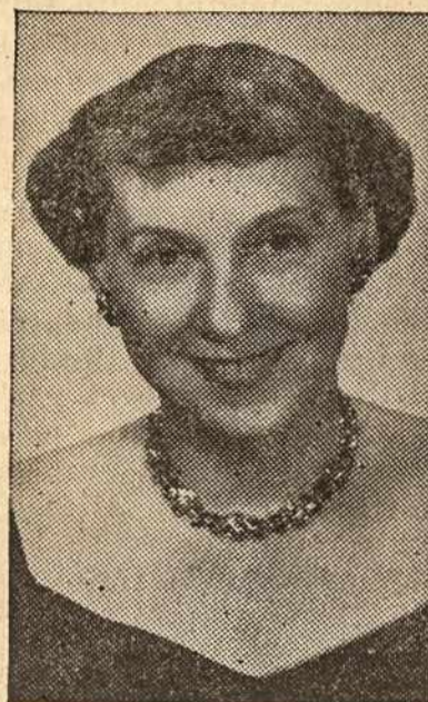
Ponia Dwight D. Eisenhower, dabartinio Prezidento Eisenhower žmona

Vašingtone prileidžiama, kad priemonės priversiančios komunistus pasiduoti bus sekančio: 1. Daugiau divizijų paginkluoti Korejoje ir Indokinijoje. 2. Daugiau ginkluoti divizijos kiniečių nacionalistų armijoje. 3. Pabaigti su Formozos neutralumu ir leisti Kinijos nacionalistų kariuomenei įsikelti į Kinijos kontinentą. 4. Sustiprinti Šiaurės Korejos bombardavimą, net subombarduojant aviacijos bazes Mandžūrijoje. 5. Isikelti komunistų fronto užnugaryje apie 40