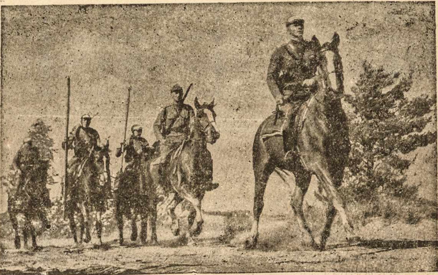
Juodbėriai galvas aukštyn!...