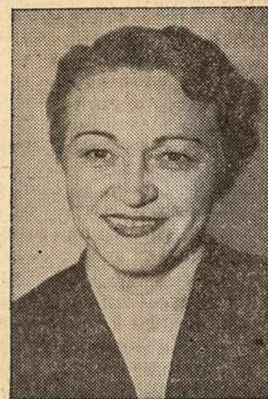
Ponia Ivy Baker Priest, Utah estado respublikonių atstovė Partijos suvažiavimuose nuo 1944 metų, Prez. Eisenhowerio valdžioje bus Amerikos išdininkė