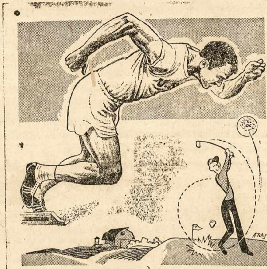
Greičiausias pasauly bėgikas. Bobby Morrow, 1956 m. Melbourne, tarpatautinėje olimpiadoje laimėjęs pirmą vietą 100 ir 200 metrų bėgime. Jis yra studentas. Baigęs mokslus nori įsigyti vatos ūkį. Taip pat mėgsta golfą ir vandens sportą.

Dabar perduosiu jums Švento Tėvo dovaną. Tegul Kristaus Vietininko palaiminimas nužengia ant jūsų visų, kurie esate Vokietijoje, kurie išsisklaidę įvairiuose kraštuose, ar yra tėvynėje. Tenužengia šis palaiminimas ant visų Lietuvos vaikų, nešdamas tėviškos meilės paguodą. Ypač būdu tenužengia šis palaiminimas ir ant šios gimnazijos. Linkiu jai sviesiausios sėkmės. Šiai kultūrinei institucijai labai pritinka tradicinis linkėjimas: Vivat, crescat floreat! Taigi, gyvuokite, aukite, žydėkite jūsų asmeniškai ir jūsų brangiosios tėvynės ateičiai.