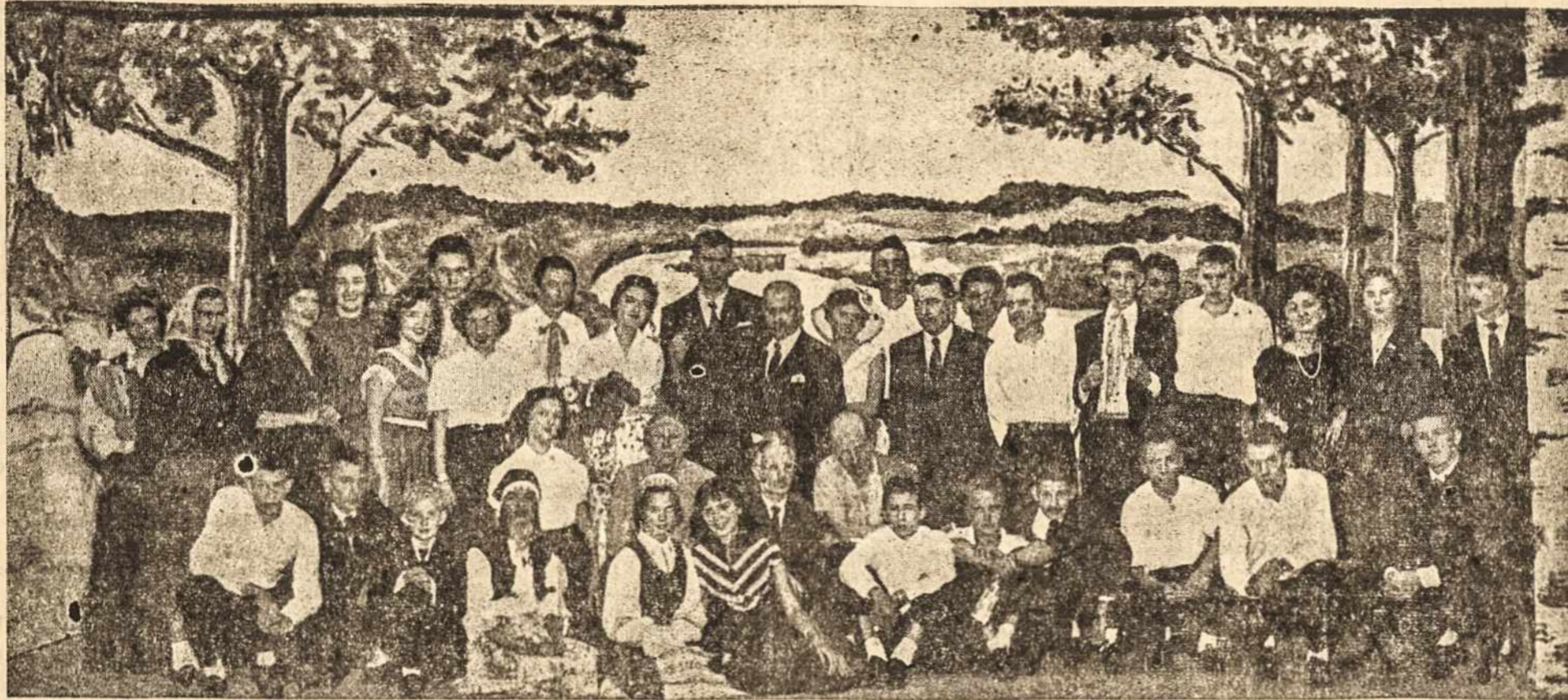
Pernykštės Jaunimo Šventės artistai suvaidinę «Atžalyną» šiomet per jaunimo šventę bus suvaidinta «Nulinę Varpos»