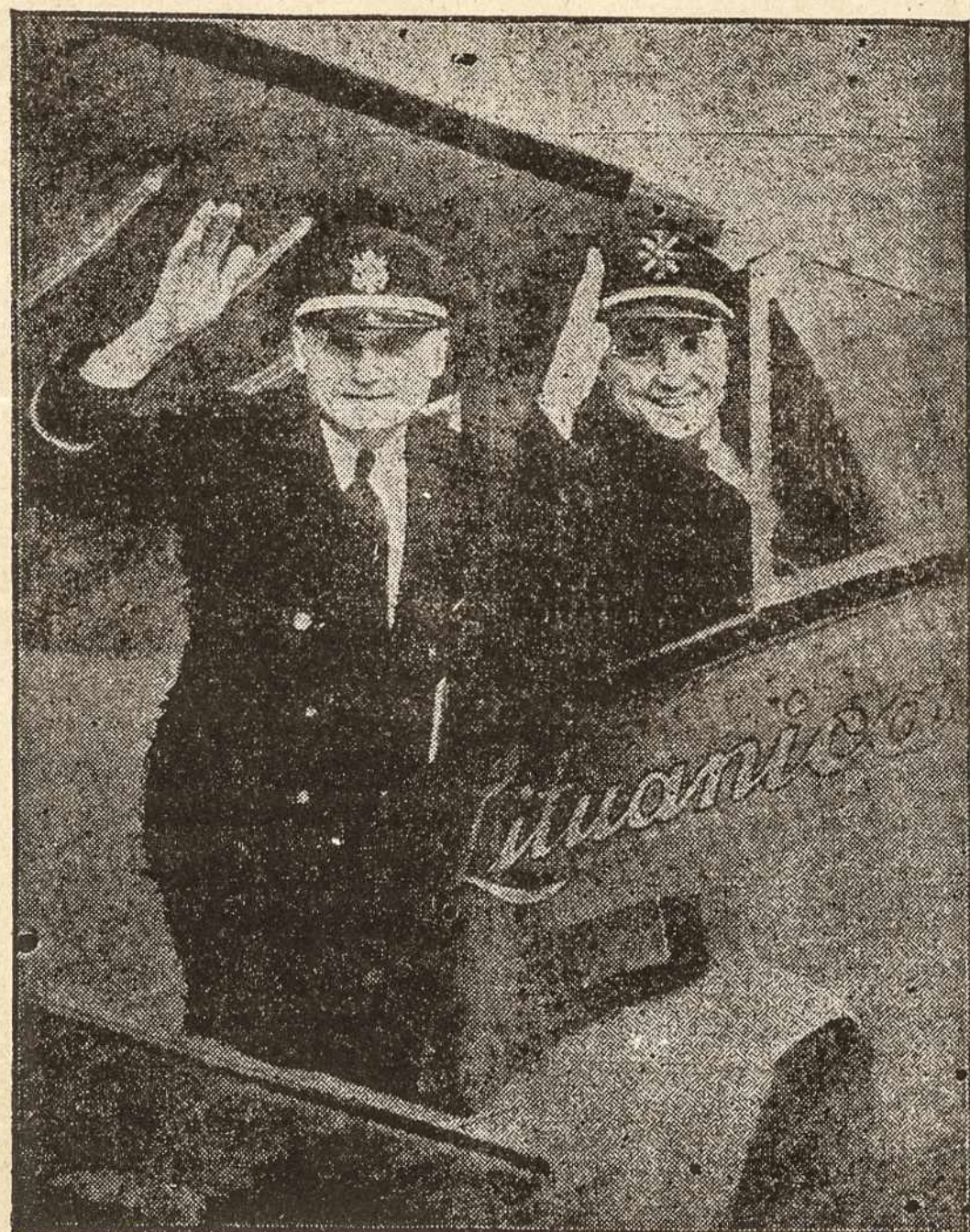
Stepas Darius - Stasys Girėnas

Žiniomis iš Maskvos, Bulganino pozicija silpnėja. Pavyzdžiui važinėjant po Čekoslovakiją su Kruščevu, jis buvo nustumtas į antraeilę vietą. Kalbas sakė, sutartis pasirašė Kruščiovas, už jo nuolankiai stovėjo Bulganinas. Spėjama kad jis gali būti atleistas pensijon, ar duota kitos pareigos. Nauju min. pirm. turėtų būti maršalas Žukovas.