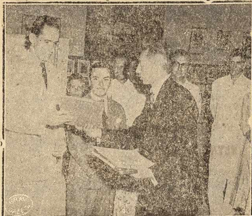
LIETUVOS ARCHIT. PARODOS PADĖKOS AKTAS.

— Os meus parabéns e profunda admiração ante esta mostra d'arte que bem reflete o espírito de uma grande