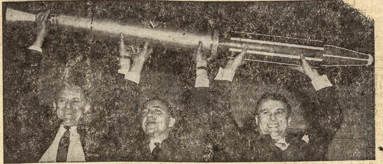
Šių trijų mokslininkų dėka Šiaurės Amerikos satelitas buvo paleistas į erdvę; Dr. William H. Pickering, Kalifornijos technologijos direktorius; Dr. James Van Allen, Iowa universiteto profesorius, kuris suprojektavo didelę dalį mokslinių instrumentų patalpintų satelite; Dr. Wernher von Braun, kurio priežiūroje buvo pagaminta raketinė bomba «Jupiter-C», iškėlusį satelitą «Explorer» į erdvę. Mokslininkai iškėlę laiko satelito pavyzdį.

— Kolumbijoje kovo m. 16 d. vyksta rinkimai į parlamentą. Dabar Kolumbija val-