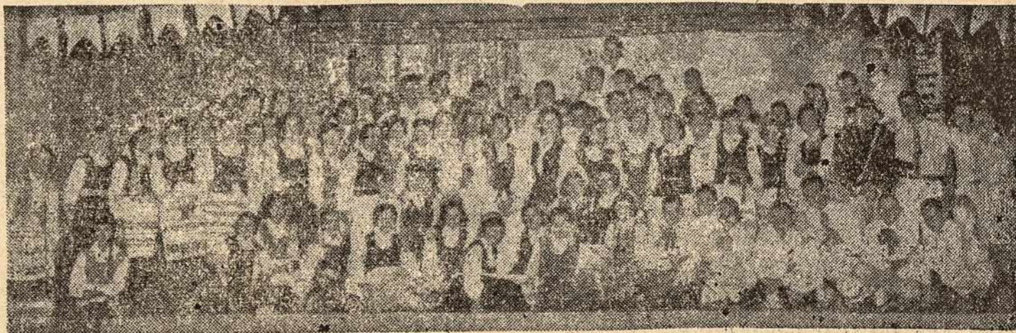
Vieningai būry susispietęs São Paulo lietuviškas jaunimas - Jaunimo Šventės programos dalyviai