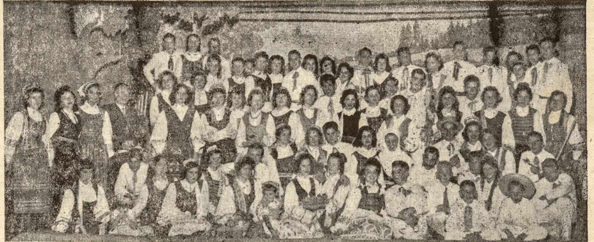
Kiekvienam lietuviškam parengime sutinkame mūsų gyvą jaunimą

Per Paskutinius 50 metų astronomijos knygų turinys labai pasikeitė, nes daug buvo šių «tiesų» paseno. Bet ar daug