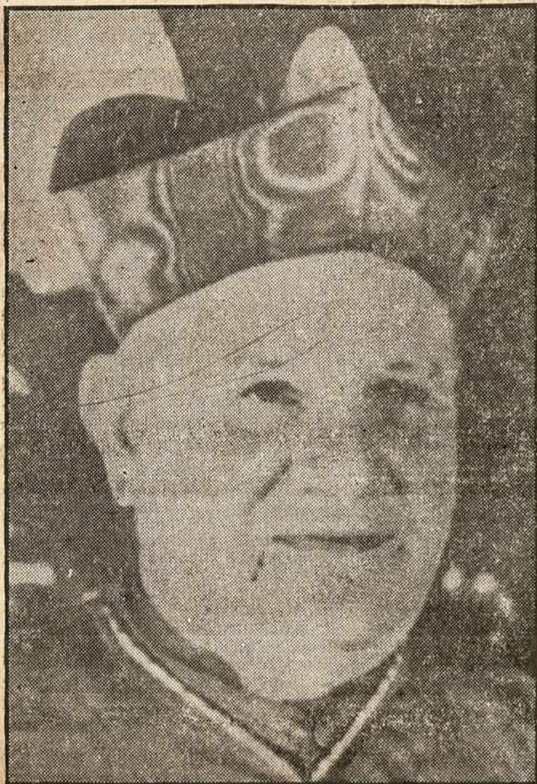
Jo Šventenybė Popiežius Jonas XXIII, kuris pirmiau vadinosi kardinolu Angelo Giuseppe Roncalli, spalio m. 28 d. išrinktas regimajai Bažnyčios galva.