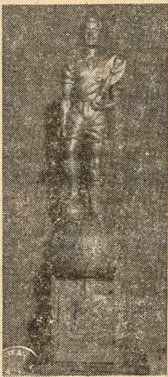
Skulptoriaus VLADO DRAMONTO KURINYŠ: Brazilijos Pasauliniam Futbolo meistrui paminėti.

— SENO MALŪNO lietuviai per p. Kučinską atsiuntė 1800 cr. užsilikusio praėjusių metų prenumeratos mokesčio Ačiū malūniečiams. Tikimės kad ir kiti neužtruks su skolom.