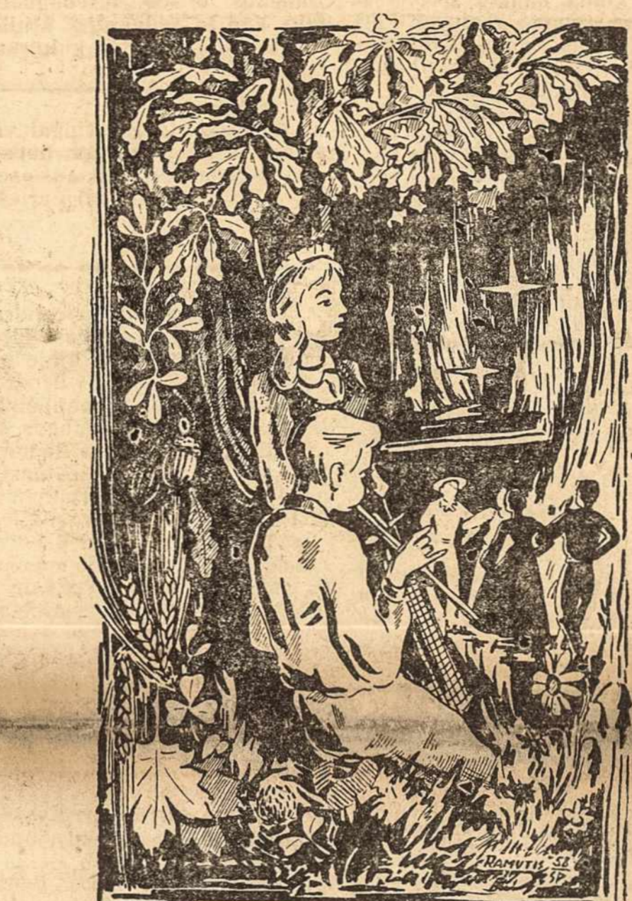
Lietuviška spauda yra šviesi liepsnelė, kuri mums rodo kelią tremties sutemose.

čius nuo Vilniaus, yra garsus savo praeitimi Ašmenos miestelis. Kada jis įkurtas, sunku pasakyti. 1040 metais Ašmena jau minima anų laikų užrašuose. Taigi, visai galimas daiktas, jog Ašmena jau sulaukė tūkstanties metų amžiaus.