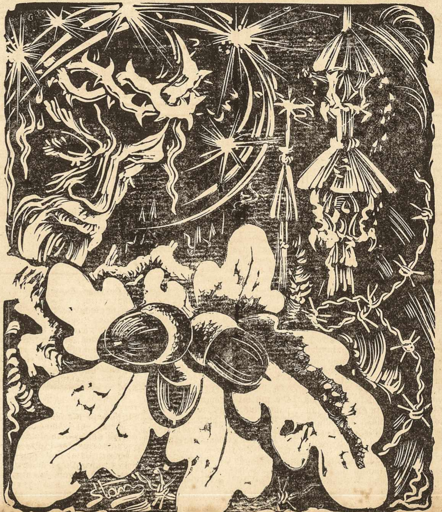
RŪPINTOJĖLIS AZUOLĖ — Dail. V. Stančikaitės Abraitienės linoleumo rašiny

Didžiausia tremtinių dauguma dirbo miško kirtimo ir plukdymo darbuose. Visi mūsų eša