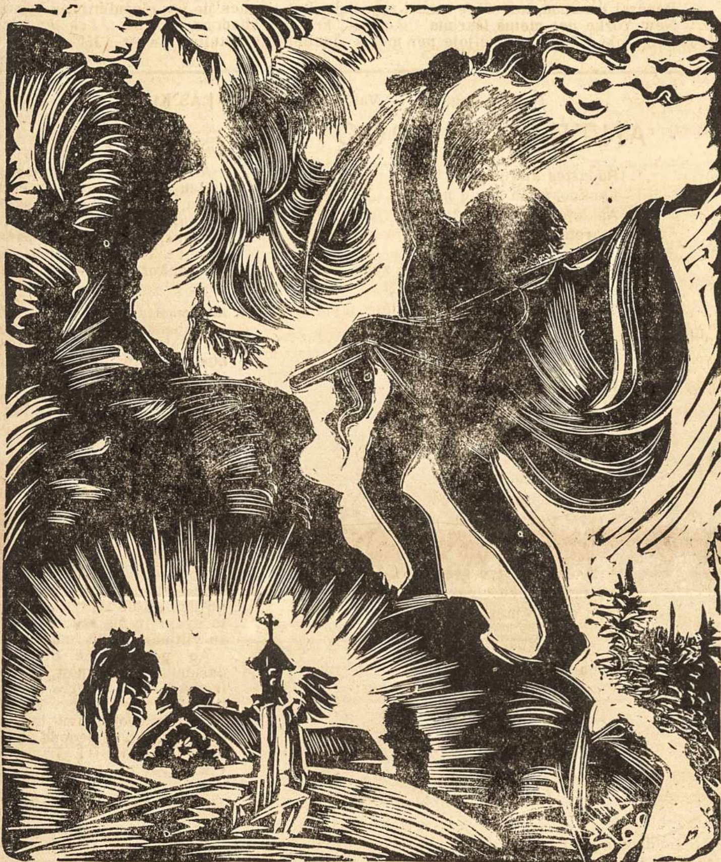
Dal. V. Stančikaitės. Abstraitinės «IDEALISTAS», iškėlęs vėliavą save pamiršęs, ne- bodamas kojas raizančių uolų kopia į aukštumas, kalnus, o jo širdy mažytė tėviškės sody- ba, jam už visus dangoraižius brangesnė.