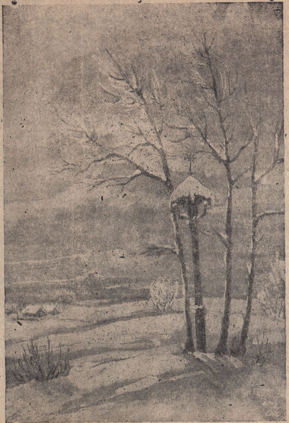
Lietuvoj žiemos vaizdelis

Pro salės langą skverbėsi šiltas vėjas glostydamas kas taurinai nudazytus Zofijos plaukus. Jis skraidė po salę linksmas ir nerūpestingas, naujoje tėvynėje šį vakarą. Itališkoje vazoje alpo raudonos rožės sklaidamos saldu mirties kvapą, o už lango berybėje juodoje erdvėje skaisčiai mirgėjo Kristaus Užgimimo žvaigždė nešanti ramybę ir taiką geros valios žmonėms.