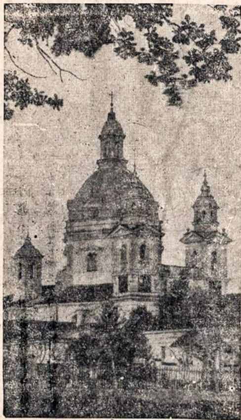
Pajaisko bažnyčia prie Kauno.