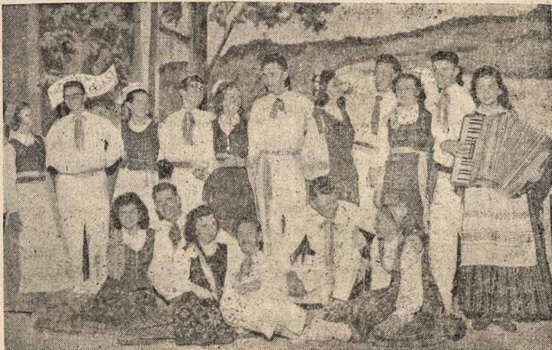
Tautiniai susipratęs jaunimas — mūsų brazilijos lietuvių kolonijos ateitis.