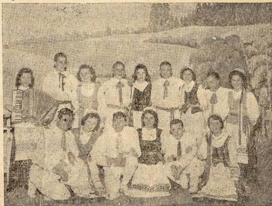
S. Paulo (Bom Retiro) lietuviško jaunimo grupė

ja išėjo moksliskai pagrįsta Pastatytas krikščioniškasis naujo sąjūdžio Credo.